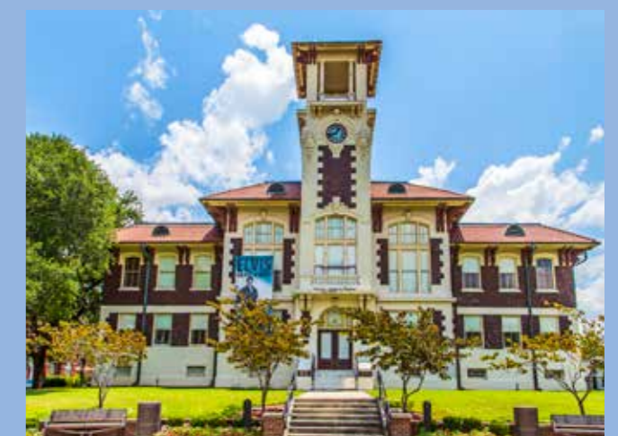
Історична ратуша Лейк-Чарльза, Луїзіана

Штат Луїзіана було названо французькими поселенцями 17-го століття на честь короля Франції Людовика XIV. Місто, що виросло на березі озера Чарльз, на південному заході штату, стало великим важливим промисловим центром. Його важливість як комерційного порту зростала після завершення громадянської війни (1861-65). Величезні обсяги деревини були необхідні для відновлення Півдня, і більша частина транспортувалася через порт озера Чарльз. У 1920-х рр. збудували канал, який з'єднав різні невеликі озера, річки і водні шляхи, щоб забезпечити доступ великих суден до порту, який знаходиться в 30 милях від Мексиканської затоки. Сьогодні Порт-Лейк-Чарльз є дванадцятим найнадійнішим у Сполучених Штатах, що займається в основному нафтою та продовольчим постачанням для решти світу.